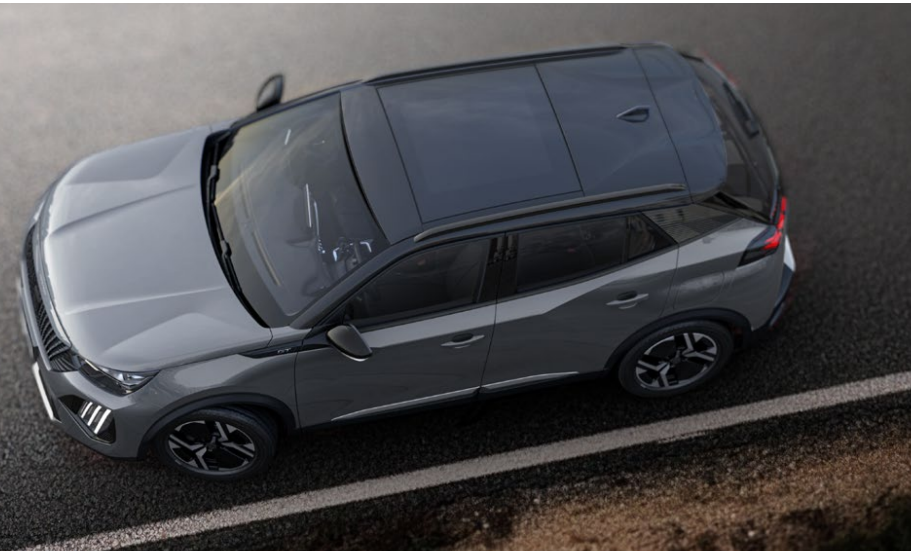
TECHO PANORÁMICO + SUNROOF (ONE TOUCH)