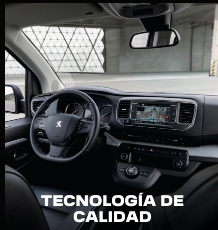
TECNOLOGÍA DE CALIDAD